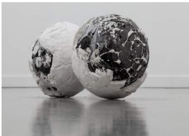
Credits: Matea Bakula, The escape of the soft sounds , 2018 - LumenTravoGalerie

Uitreiking woensdag 6 februari tijdens opening Art Rotterdam 2019