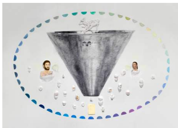
Credits: Femmy Otten, One Year in Ten #2 , 2017 - Galerie Fons Welters