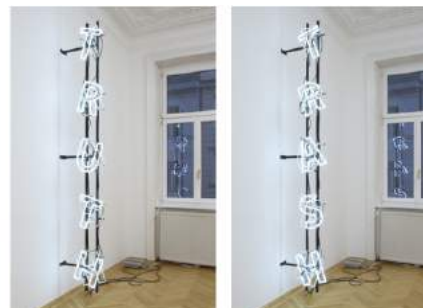
FAMED ASPN Room for an answer, 2018