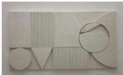
Untitled Galerie Fontana Theater of Disorder, 2016