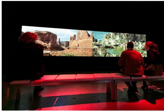
Het videogedeelte Projecties komt terug in een extra groot formaat