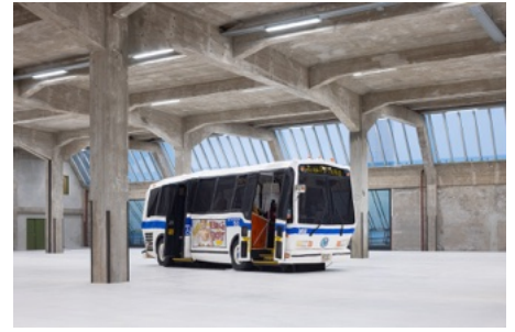
Red Grooms 'The bus', 1995 Fenix, Rotterdam