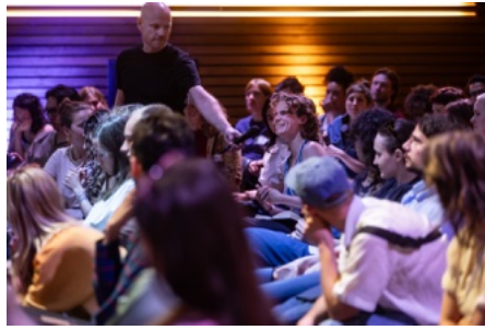
Mondriaan Fonds Power up your art practice